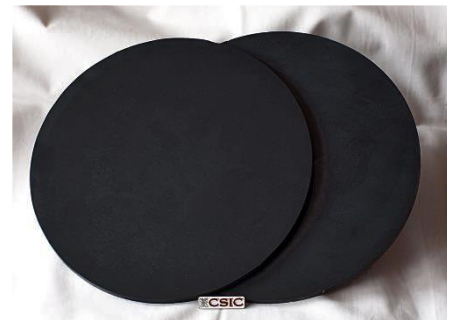
Aspecto del material resultante